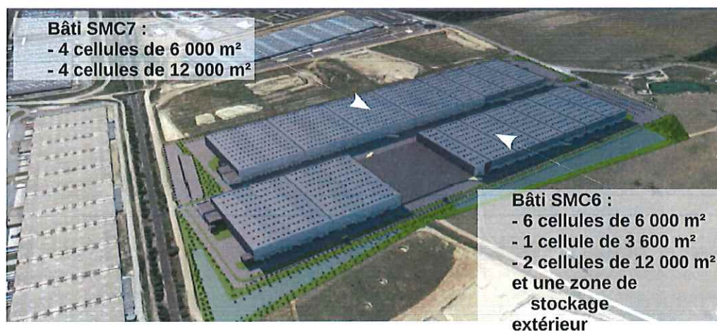
Vue en trois dimensions du projet achevé

Les caractéristiques prévues pour les deux bâtiments, une fois achevés, sont les suivantes :